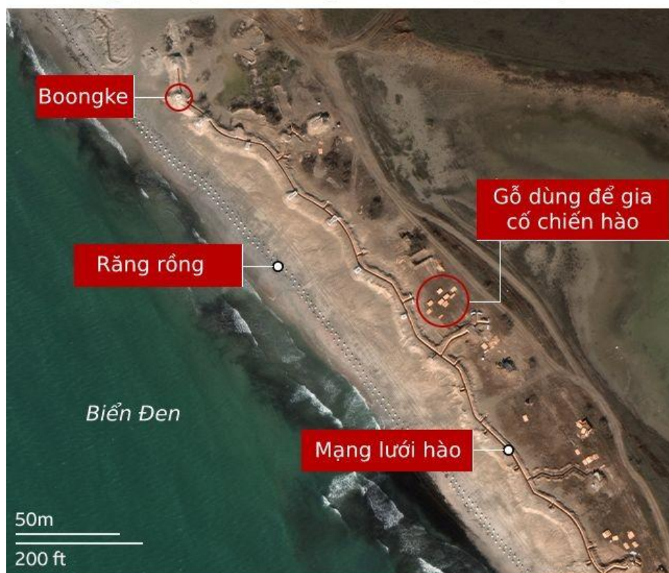
Hệ thống phòng thủ của Nga ở bờ biển phía tây Crimea

Hình ảnh dưới đây cho thấy bãi cát lộ thiên duy nhất ở bờ biển phía tây không có các công trình phòng thủ tự nhiên như vách đá hoặc đồi.